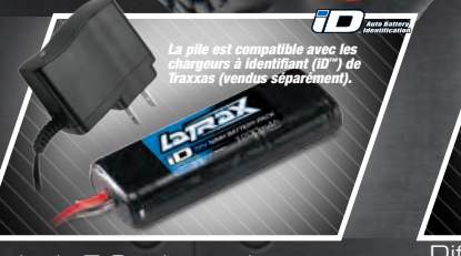
Batterie de 7,2 volts et chargeur c.a. Paquete de baterías de 7,2 voltios y cargador de CA 7,2-Volt Batterie und AC-Ladegerät