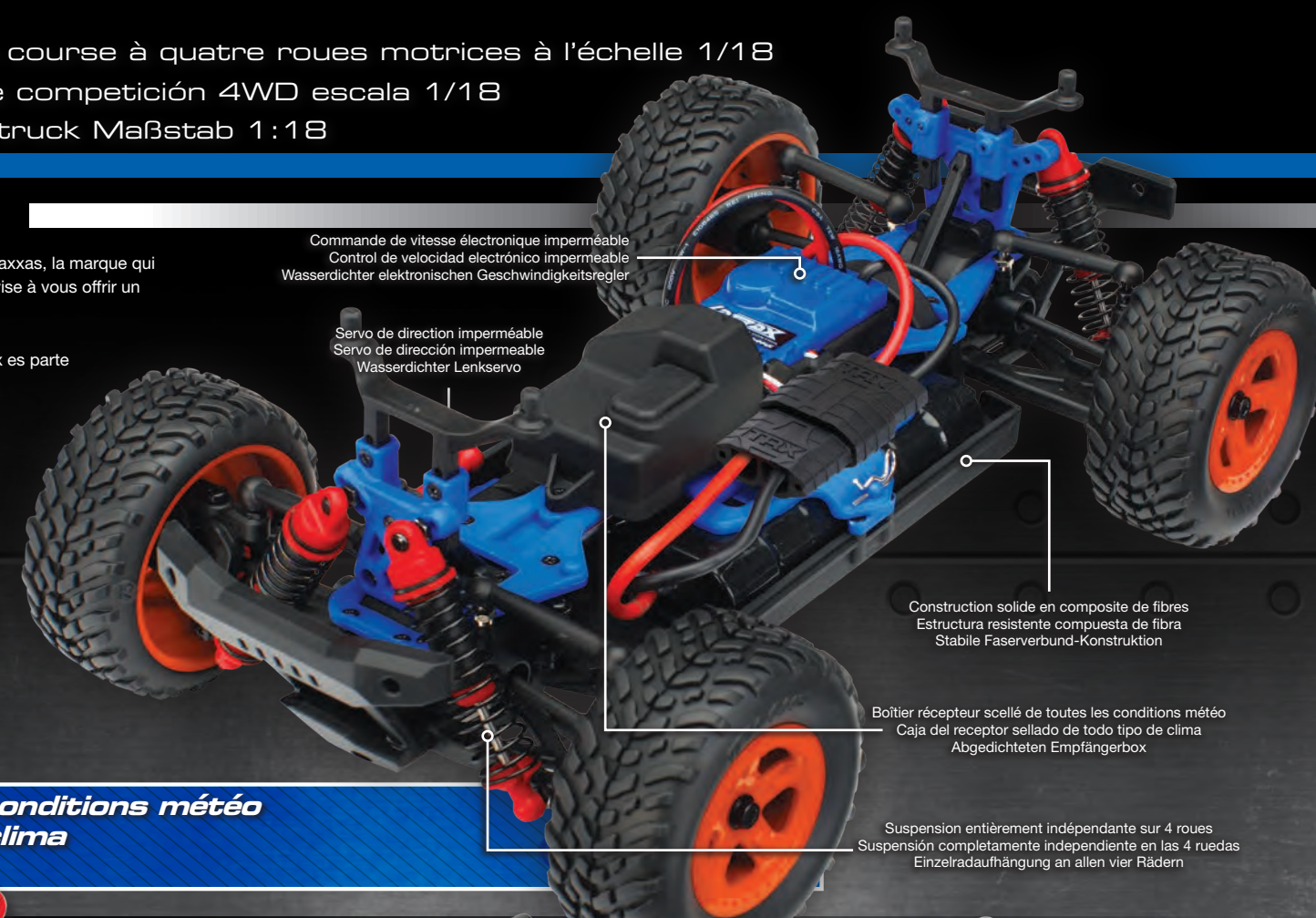
Commande de vitesse électronique imperméable Control de velocidad electrónico impermeable Wasserdichter elektronischer Geschwindigkeitsregler