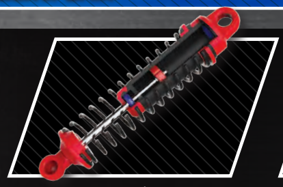
Amortisseurs à fluide Amortiguadores de aceite Öldruckstoßdämpfer

Piles Alcalines AA fournies | Baterías AA alcalinas incluidas | AA Alkaline Batterien im Lieferumfang enthalten