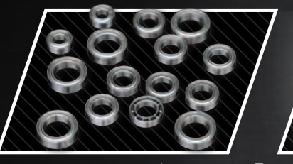
Tous les roulements à billes Rodamientos completos Volle Kugellager